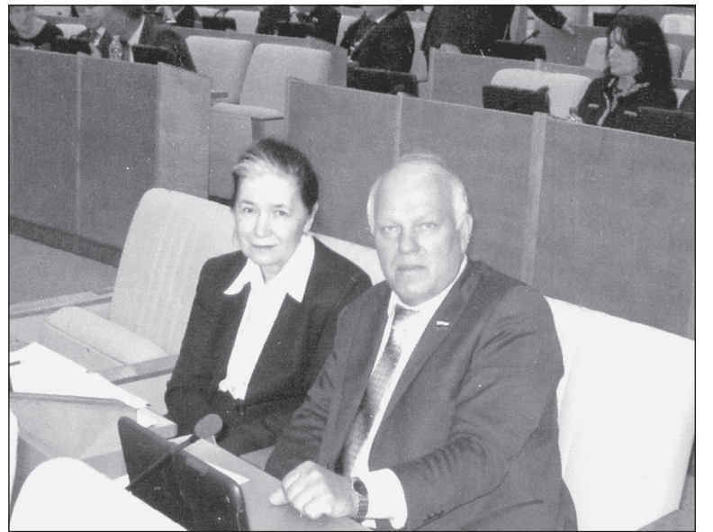
На снимке: заместитель председателя комитета ГД РФ по экологии и землепользованию А. ГРЕШНЕВИКОВ и председатель комитета по жилищной политике и жилищно-коммунальному хозяйству ГД РФ Г. ХОВАНСКАЯ на сессии Госдумы, где рассматривается взнос на капремонт.

Галина ХОВАНСКАЯ, председатель комитета Госдумы по ЖКХ.