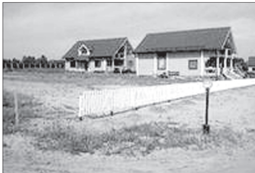
"Северная пасека". Такая вот «инфраструктура».

Из этого же представления следует, что строительство поселка осуществлялось с существенными нарушениями законодательства о градостроительстве, в том числе в отсутствие экспертиз и надзорных мероприятий, хотя из письма начальника Управления государственного строительного надзора Федеральной Службы по экологическому, технологическому и атомному надзору Артюха Ю.А. (от 08.11.2007 №09-1/