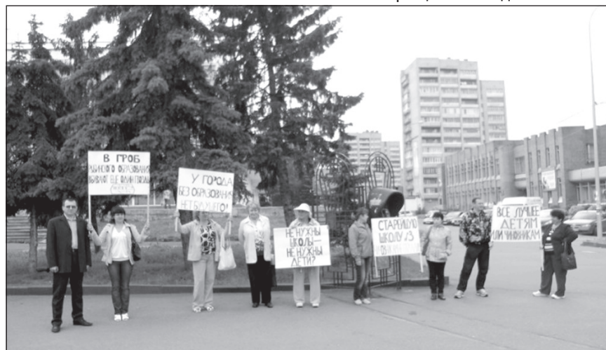
Пикет справедливороссов в Рыбинске против закрытия школ.

Чехарда со школами усиливает разруху в Рыбинске, т.к. разруха, все знают, начинается в головах. Следует перестать делить школы на плохие и хорошие. Плохих школ не бывает и быть не должно. Плохо бывает там, где этого не понимают.