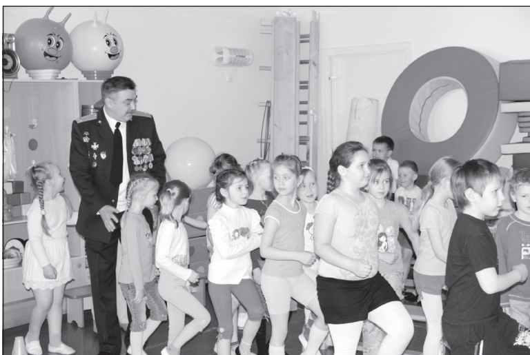
Детсад принимает дядю-военного.

– У меня двое детей. Сын пошел по моим стопам, был военным, капитан. Сейчас, после сокращения армии, и он в запасе. Есть и внуки. Дочка тоже получила образование, вышла замуж. У них все хорошо, и в этом для меня счастье.