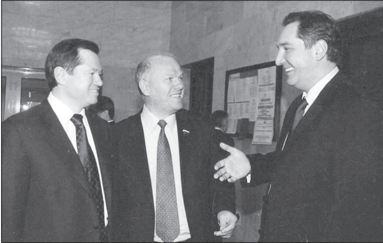
На снимке: С. ГЛАЗЬБЕВ, А. ГРЕШНЕВИКОВ и Д. РОГОЗИН.

На днях А.Н. Грешневиков вошел в Общественный совет «Роскосмоса».