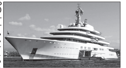
На снимке: новая 8-палубная яхта Абрамовича.

Деньги на яхты, виллы, футбольный клуб Абрамович брал и берет в России, у народа... Ему плевать на народ, пусть беднеет, звереет, ведь тот на выборы не ходит и тем самым позволяет единороссовским Абрамовичам пухнуть от денег и издеваться над тем же народом.