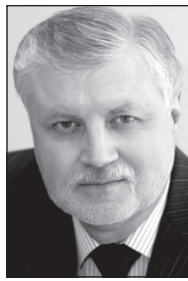
Сергей МИРОНОВ, лидер фракции СПРАВЕДЛИВАЯ РОССИЯ.

Это бюджет социальной стагнации, это бюджет выживания, а не развития. Да, слава Богу, основные социальные обязательства государства правительство готово выполнять, и это заложено в бюджете, но мы не видим никакого реального развития, не видим увеличения зарплат бюджетников, мы не видим и