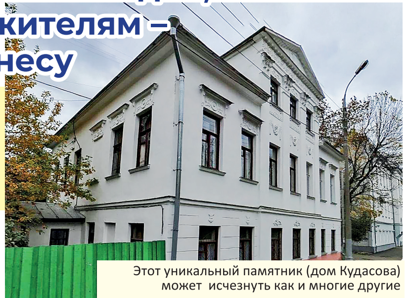
Этот уникальный памятник (дом Кудасова) может исчезнуть как и многие другие

Нам известно, что проект планировки территории и проект межевания вступают в силу только при условии вступления в силу изменений в режим 3 использования, проектирования и строительства на территории объекта