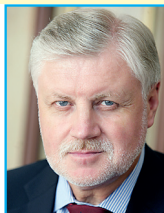
Сергей Миронов, лидер партии СПРАВЕДЛИВАЯ РОССИЯ – ЗА ПРАВДУ

У партии «Справедливая Россия – за правду» есть целый набор конкретных инициатив в сфере демографии, социального обеспечения, предоставления жилья. Прогрессивный маткапитал, ежемесячный базовый доход для семей с детьми, погашение ипотеки для многодетных и многое другое. Но главное – мы точно знаем, сколько на это нужно денег и где их взять.