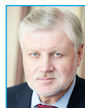
Сергей Миронов, лидер партии СПРАВЕДЛИВАЯ РОССИЯ – ЗА ПРАВДУ

Фракция «Справедливая Россия» внесла закон о том, чтобы ставка врача без всяких надбавок составляла не менее 200% от средней зарплаты в регионе. Нужно повысить федеральные расходы на медицину до 7% от ВВП. Мы за отмену посреднического звена – Фонда медицинского страхования и частных страховых компаний, за введение единой системы оплаты труда в отрасли.