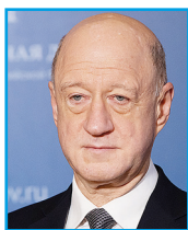
Александр Бабаков, заместитель председателя Госдумы РФ, член фракции «СПРАВЕДЛИВАЯ РОССИЯ – ЗА ПРАВДУ».

Они – за экономику ожидания, а мы – за экономику созидания