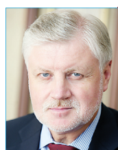
Сергей Миронов, лидер партии СПРАВЕДЛИВАЯ РОССИЯ – ЗА ПРАВДУ

Власть в миграционной политике годами бездействовала. Мы против замены нашего населения мигрантами