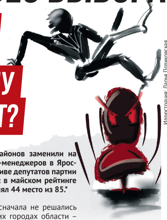
Иллюстрация: Дарья Поликовская

Всенародные выборы глав городов и районов заменили на многоступенчатую систему назначения сити-менеджеров в Ярославской области ещё в 2014 году по инициативе депутатов партии власти. Но жить наши люди лучше не стали: в майском рейтинге благосостояния российских семей регион занял 44 место из 85.*