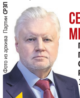
СЕРГЕЙ МИРОНОВ Председатель Партии СПРАВЕДЛИВАЯ РОССИЯ — ЗА ПРАВДУ

Там командуют матери, убеждённые бандеровцы. А когда командир — идейный нацист, то подчиненным трудно оставаться не нацистами. Это как в гитлеровском вермахте: кто там был хорошим и не замаранным в военных преступлениях? Не удивительно, что и в украинском «вермахте» в порядке вещей пытки и убийства пленных, что здесь нередки случаи, когда командиры-нацисты приказывают подчиненным выступать в роли карателей и расстреливать мирных жителей, заподозренных в симпатиях к России.