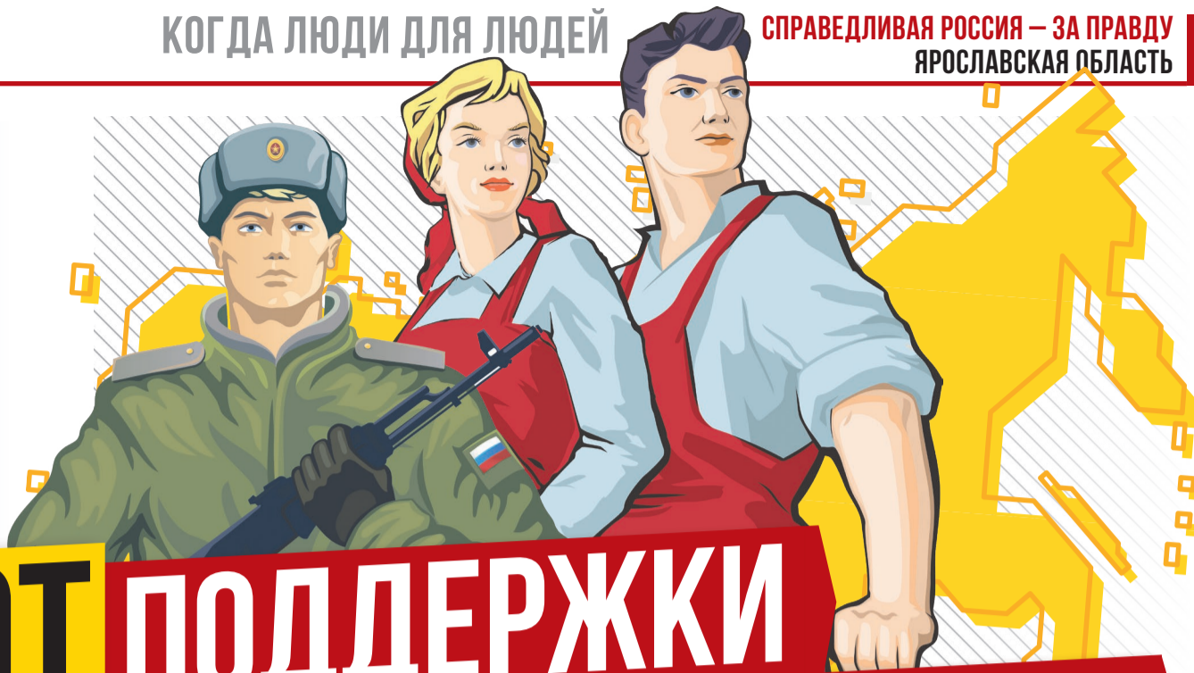
Иллюстрация: 123rf.com, коллаж: BelenissimoFoto

Послание Президента России лишь формально было адресовано Федеральному Собранию. По сути, это обращение к нации, к россиянам, к каждому из нас, считает лидер Партии СПРАВЕДЛИВАЯ РОССИЯ – ЗА ПРАВДУ Сергей Миронов. В речи Владимира Путина нашли отражение многие инициативы социалистов – от поддержки наших защитников до мер поддержки самых разных слоев российского общества. Чего уже добилась Партия СРЗП и на принятии каких справедливых законов будет настаивать?